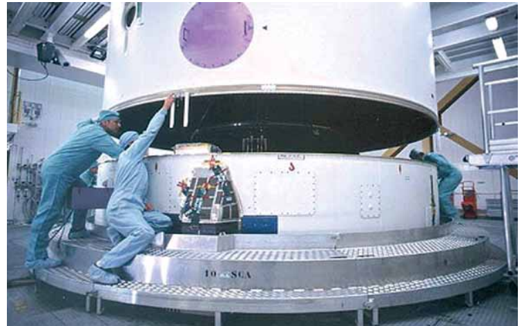
Lift and place payload fairing of an Ariane rocket