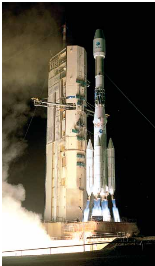
Ariane rocket 4

Zwei ZEROTRONIC Sensoren, auf dem Lastkreuz in X und Y Richtung montiert, dienen als Signalgeber. Vier Leitungen, in einem gemeinsam mit anderen Signalen genutzten Datenkabel versorgen die Sensoren mit Strom und transportieren die Daten per RS 485 Bus. Als Anzeige- und Kontrolleinheit dient ein LED - Kreuz, welches die Neigung in jeder Richtung mittels 10 LED's anzeigt. Damit gleichzeitig ein grosser Anzeigebereich zur Verfügung steht und eine präzise Justierung der horizontalen Lage möglich ist, sind die Wertigkeiten der einzelnen LED's logarithmisch programmiert. Die logische Verknüpfung der Grenzwertüberschreitungen ist so programmiert, dass ein Opencollector Ausgang bei "alles O.K." den Anker eines Freigaberelais anzieht und dieser bei Grenzwertüberschreitung oder/und bei Systemstörung abfällt. Dank grosser, zulässigen Variation für die Stromversorgung das LED Kreuzes, welches die Versorgung für die Sensoren selbst aufbereitet, konnte das System an bereits vorhandener Speisung angeschlossen werden. Zum Einstellen des Nullpunktes, zum Setzen des Grenzwertes und zum allfälligen Ändern der logischen Signalverknüpfung gehört ein LEVELMETER 2000 als Servicegerät zum Lieferumfang.