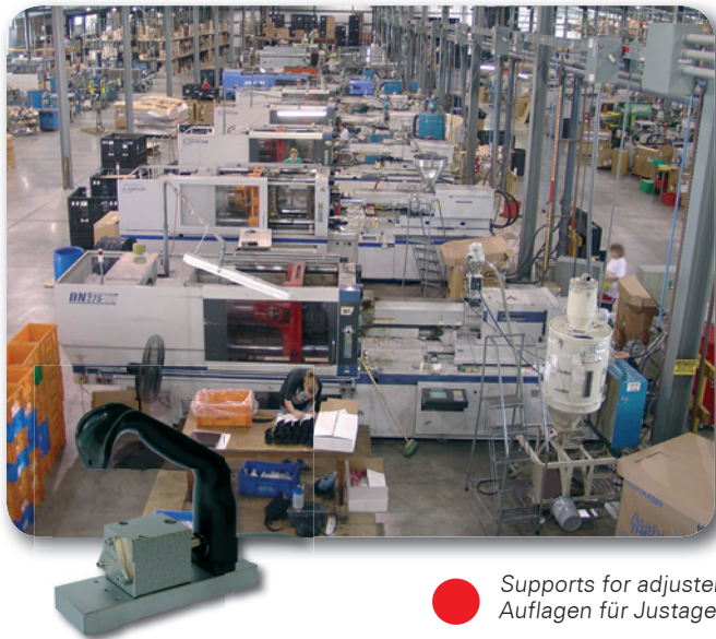
● Supports for adjustment Auflagen für Justage